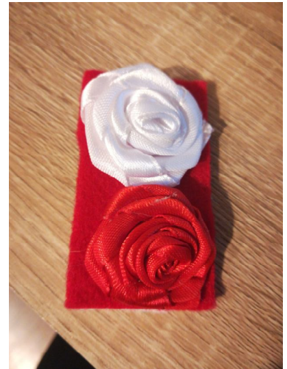
Te piękne, ręcznie zrobione kotyliony rozdawały uczennice z Samorządu Uczniowskiego

To był naprawdę uroczysty dzień w szkole. Wszyscy byli odświętnie ubrani. Nikt nie zapomniał też o symbolicznym kotylionie.